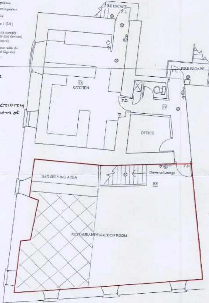
FIRST FLOOR PLAN SCALE 1 : 100

— LICENSING ACTIVITY & CONSUMPTION OF ALCOHOL