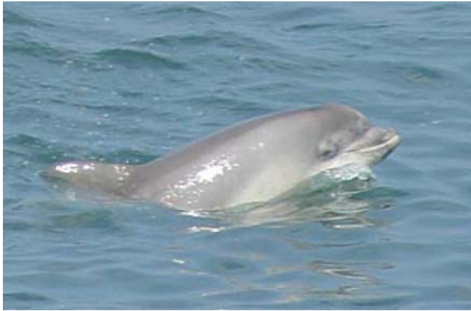
LLun / Photo: Janet Baxter