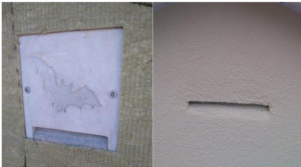
Figure C2- 1: Ffigur C2- 2: Enghraifft o flwch ystlumod fel mesur lliniaru/gwelliant