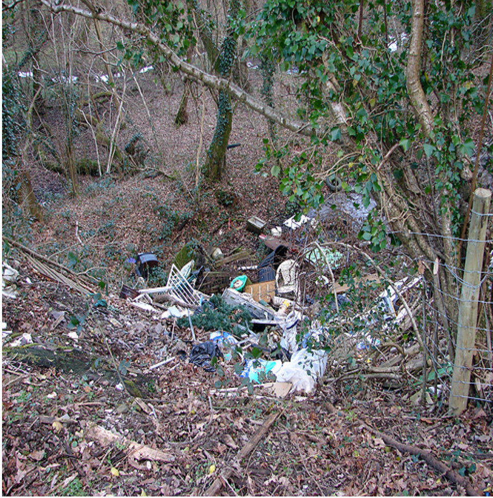
Tipio Anghyfreithlon yn Nyffryn Rheidol

Cyflwynodd yr Aelodau argymhellion i'r Cabinet. Cytunwyd â'r argymhellion a cawsant eu rhoi ar waith.