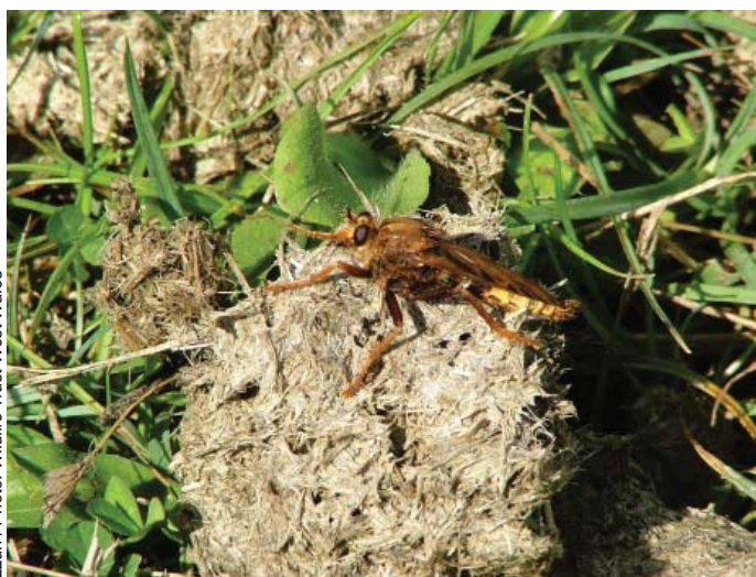
LLun / Photo: Wildlife Trust West Wales